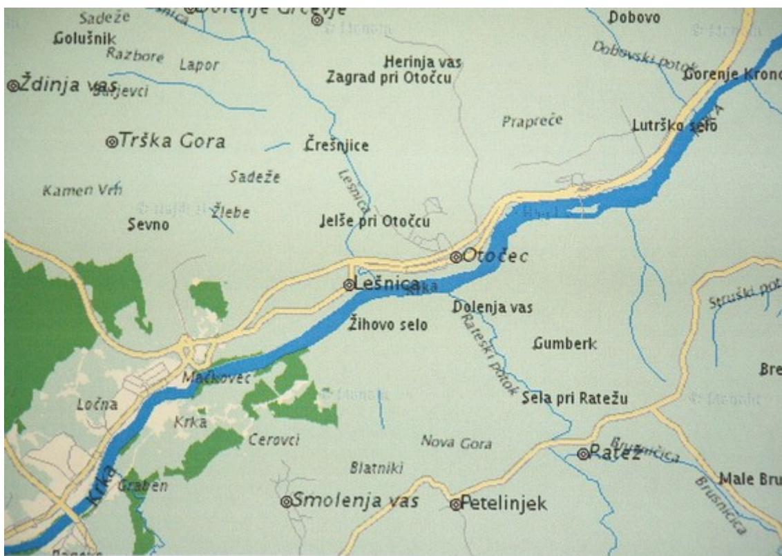
SLIKA 1: ŠOLSKI OKOLIŠ OŠ OTOČEC

V skladu z Zakonom o osnovni šoli ustanoviteljica šole zagotavlja brezplačni prevoz za vse učence, ki imajo stalno prebivališče oddaljeno od šole več kot 4 km, ali pa je njihova pot nevarna, kar potrdi Svet za preventivo v cestnem prometu.