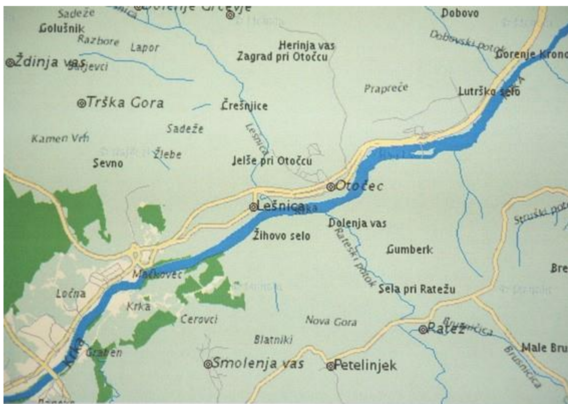
SLIKA 1: ŠOLSKI OKOLIŠ OŠ OTOČEC

V skladu z Zakonom o osnovni šoli ustanoviteljica šole zagotavlja brezplačni prevoz za vse učence, ki imajo stalno prebivališče oddaljeno od šole več kot 4 km, ali pa je njihova pot nevarna, kar potrdi Svet za preventivo v cestnem prometu.